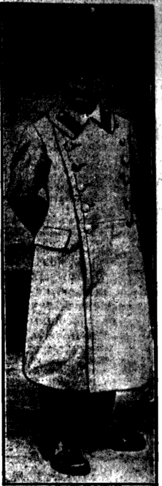
Perski następca tronu Najstarszy syn szacha Riza Kham Shapoor Mahomed Riza otrzymał tytuł następcy tronu.

Obecnie donoszą znów, że b. kronprinc niemiecki nabył wspaniałą willę „Castagnola” nad jeziorem Maggiore, gdzie zamierza osiąść na stałe.