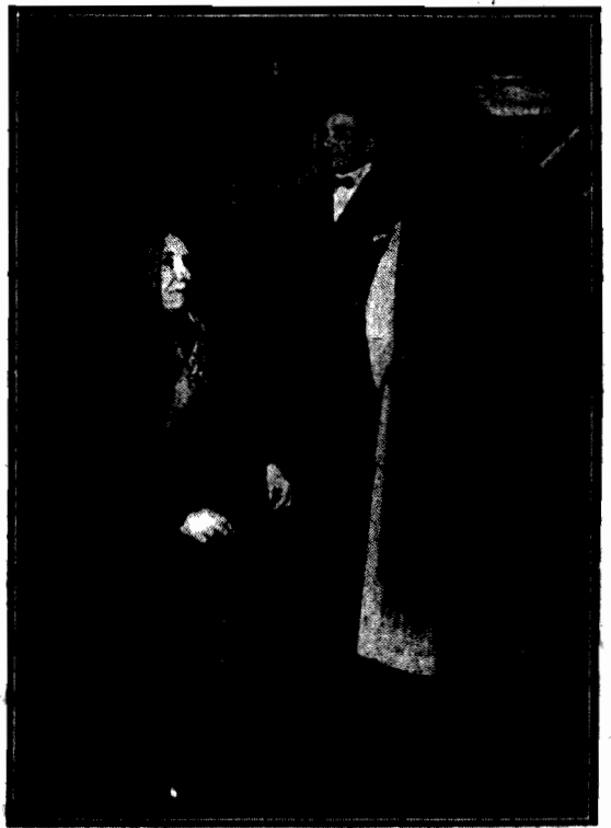
Na konkursie długości włosów w Berlinie pierwszą nagrodę otrzymała właścicielka włosów, długości 2.32 mtr. (na ilustracji nagrodzona pierwszą nagrodą widzimy stojącą na prawo). Niewiasta siedząca — sześćdziesięcioletnia starszuszka — uchwalała w dalszych czasach, mknących pod znakiem „a la garson”. 2-metrowej długości włosy i zdobyła drugą nagrodę.