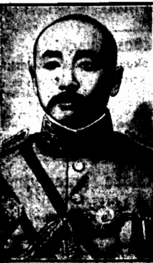
Wojna domowa w Chinach Gen. Csang - Tso - Lin, jeden z dowódców chińskich, którego armia została zniszczona przez zwycięskiego w wojnie domowej gen. Li - Cung - Lina.