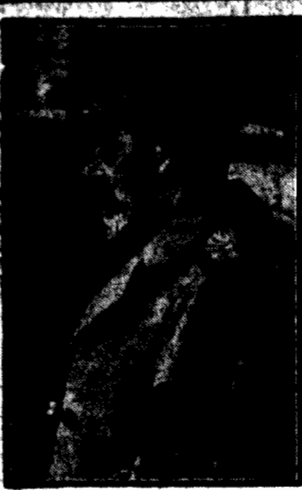
Władca W. Brytanii Wielki korpus Intymierski, Chłubi Anglii.

ZURYCH, 27. 3. Warszawa 63.50. Akcje B. Polski 47 i pół, B. Dykamentowy 5.60, B. Handlowy 1.75, B. Zachodni 4.85, B. Zw. Sp. Zec. 4.80, Słom 2.30.